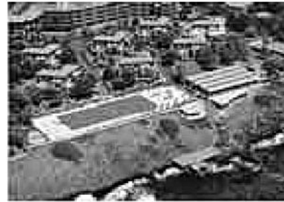
IL COMPLESSO DELLA PERLA JONICA